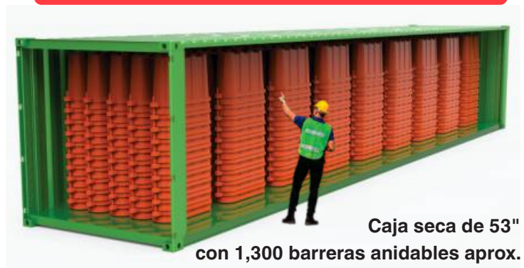
Caja seca de 53" con 1,300 barreras anidables aprox. Canalizando 1950 mts. lineales