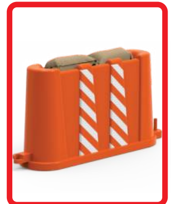
2 COSTALES DE ARENA OPCIONALES DE 10.00 KG C/U