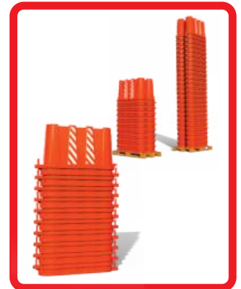
ALMACENAJE HASTA 99 PZS POR TARIMA