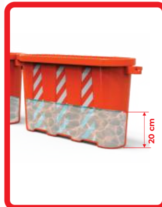
LLENADO CON AGUA HASTA 20 cm MÁXIMO