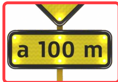
IDEAL COMO ADICIONAL